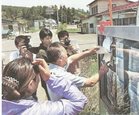
空間線量計(掲示板上の赤い物体)が測定した1日ごとの放射線量を確認する村民