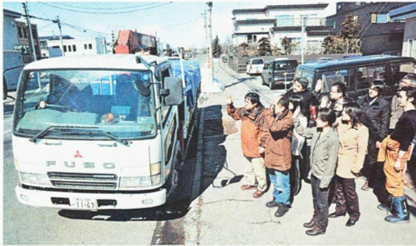
被災地に向けて出発した支援物資を載せたトラック(17日午後0時半すぎ)