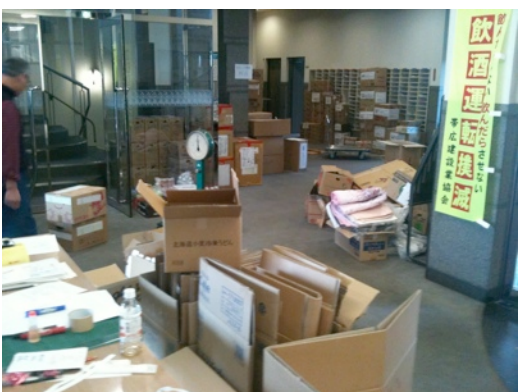
帯広建設業協会での支援物資積み込み