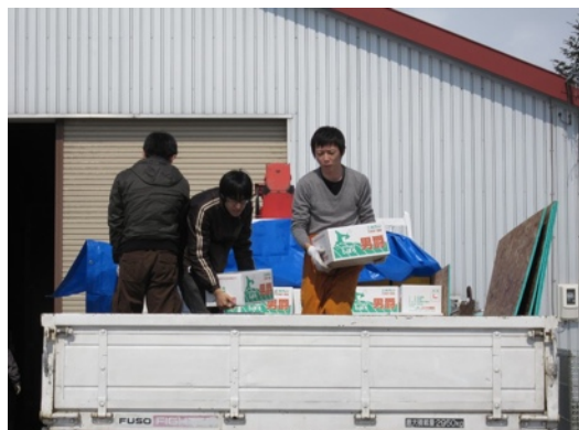
農家からじゃがいも3t