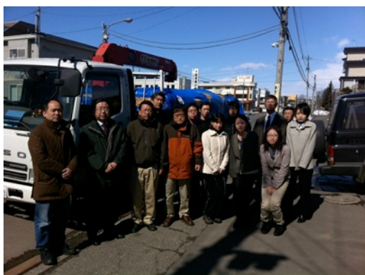
第一弾宮城県復旧本部行き出発