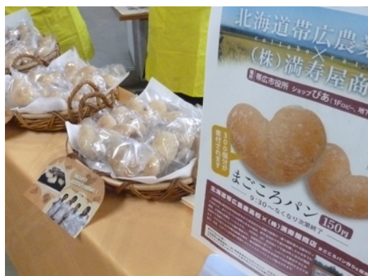
帯広市役所にてチャリティーパン販売