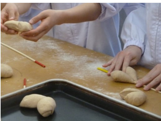
ますやと帯広農業高校の共同チャリティーパン作り