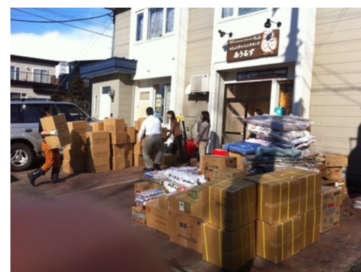
お預かりしました沢山の支援物資