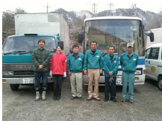
帯広建設業協会と共同支援の出発式