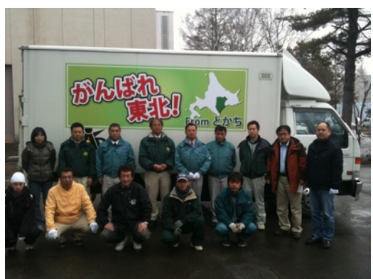
第二弾岩手県岩泉町行き出発