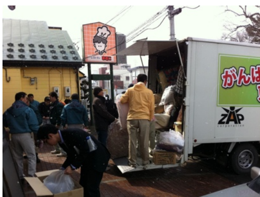
帯広畜産大学の皆様と積み込み