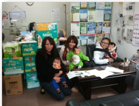
おむつを持って来てくれた若いお母さんたち