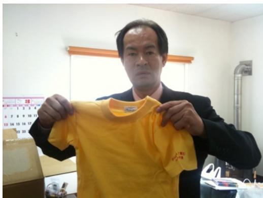
ウィネットからTシャツ