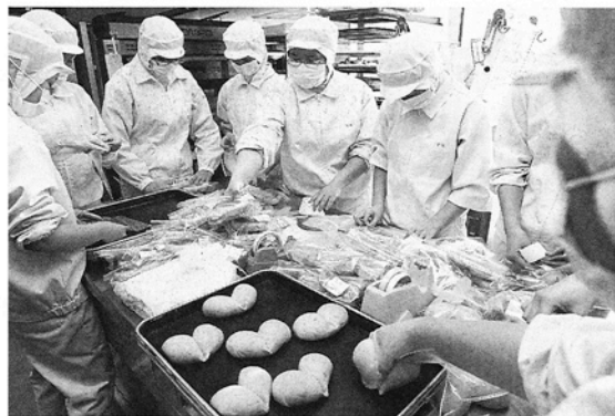
焼き上げたパンをつづつ袋に詰める帯広農業高の生徒

食品科学科小麦班の2年生10人。被災地を支援したいと提案し、小麦栽培の実習先だったパン造販売の満寿屋商店の協力を得て実現した。